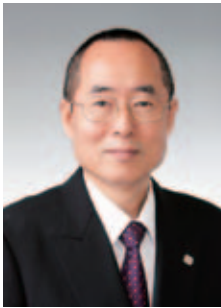
中学・高等学校 校長

昭和51年3月 京都大学大学院教育学部 研究科修士課程修了 同 57年4月 龍谷大学短期大学部 専任講師 同 59年4月 龍谷大学短期大学部助教 平成4年4月 龍谷大学短期大学部教授 同 9年4月 龍谷大学短期大学部長理事 同 15年4月 龍谷大学副学長・常務理事 同 19年4月 龍谷大学学長・専務理事