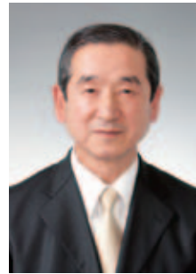
大学・短期大学部 学長