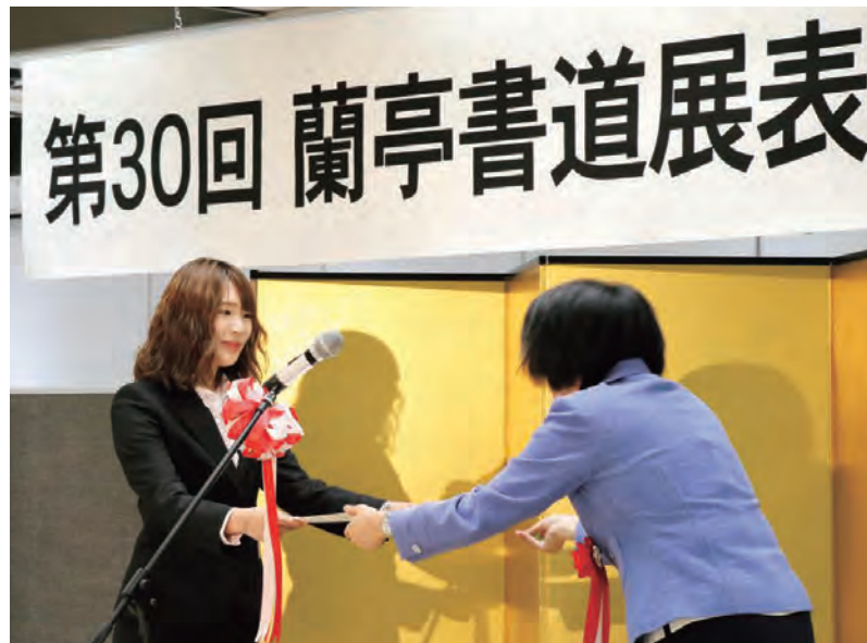
▲表彰式はとっても緊張しました。書道を続けてきて良かったと思えた瞬間でした。

勉強をはじめ、さまざまなことに積極的に取り組む筑女生の活躍ぶりを紹介するこのコーナー。今回は「蘭亭書道展」で最高賞を受賞した大学生と、ベトナム・ハノイで開催された「the World Scholar's Cup Global Round」に参加してきた高校生にご登場いただきました。