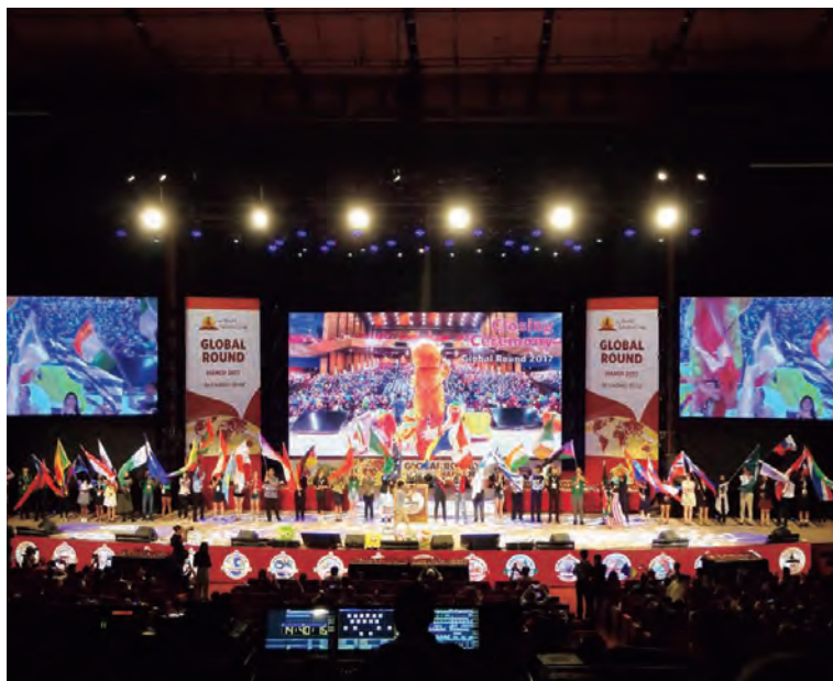
▲大会メイン会場の様子。世界中から約2,000人が参加し、すごい熱気に包まれていました。

行われた「the World Scholar's Cup Global Round」に参加しました。World Scholar's Cupとは、3人1チームでディベート(Team Debate)・エッセイ(Collaborative Writing)・マーク