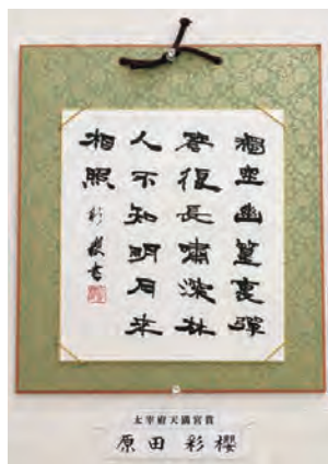
▶この作品では、バランスをとったり、文字の表情にこだわりました(受賞名は雅号)。

この作品はアジア美術館に展示されました。会場のスケールの大きさに圧倒され、この中でトップになれたと考えただけで鳥肌