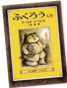
『ふくろうくん』 ●アーノルド・ローベル 作/三木 卓 訳 文化出版局刊/854円+税

就 寝前の我が家の絵本タイム。2歳離れた姉弟の読みたい本は異なることも多く、自分が選ばなかった方を読んでいるときはどこか不満げな様子。そんな2人が口を揃えて選ぶ本——。 ベッドに入ったふくろうくんがろうそくを消して眠ろうとした時、毛布の下に2つのこんもりしたのを見つめます。「もし、ぼくが寝ているうちにどんどん大きくなつたらどうしよう？」と、気になって気になって…。さて、こんもりの正体とは？ ふくろうくんの日常を描いた、ほのぼのとした5つのお話です。お人好しで、ちよっぴり間が抜けていて、無垢な心の持ち主のふくろうくん。その言動に一喜一憂し、大盛り上がりの子供たちです。 ふくろうくんが物事に正面から真っ直ぐ向き合っている姿に、真剣に悩み考える様子は、子どもたちが考え行動する姿と重なり、その姿勢はいつまでも大切にしなければと改めて考えさせられます。大人になつて子どもと一緒に絵本を読むと、以前には気づかなかった新しい発見があり、とても楽しいですね。 皆さんもお子さんと一緒に、ぜひふくろうくんのほのぼのとした世界にお越しください。