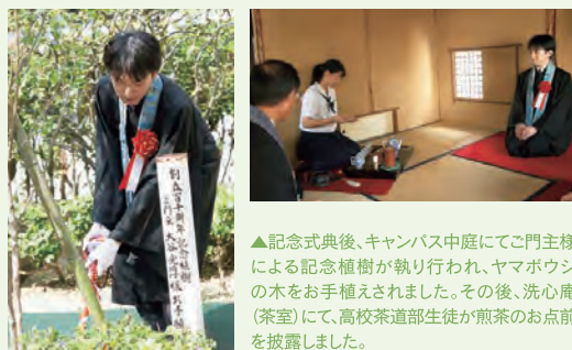
▲記念式典後、キャンパス中庭にてご門主様による記念植樹が執り行われ、ヤマボウシの木をお手植えされました。その後、洗心庵(茶室)にて、高校茶道部生徒が煎茶のお点前を披露しました。