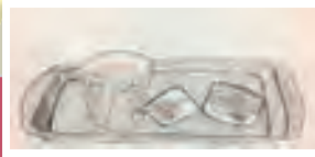
▲Dチームによる提案内容の一例

Dチーム 「四季飛行フローレット」 「溶かしてモンブラン」 「どこでも使えるタンブラーセット」