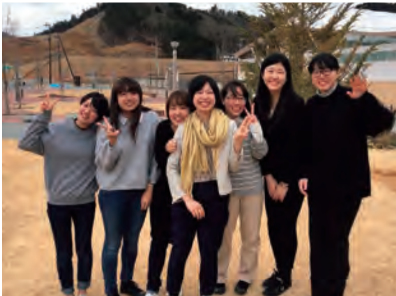
▲「復興・創生インターン」での課題に対する最終発表後、プロジェクトを共にした仲間たちと。

勉強をはじめ、さまざまなことに積極的に取り組む筑女生の活躍ぶりを紹介するこのコーナー。今回は宮城県で行われた「震災復興・創生インターン」に参加してきた大学生と、テコンドーでがんばる高校生にご登場いただきました。