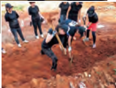
▶被災地の学校で建設作業を する学生たち(2016年8月)。