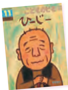
『ひーじー』 ●東郷聖美 作 「こどものとも年中向き」(2016年11月号)掲載 福音館書店 刊/389円+税

そして、どうか筑女幼稚園の図書室にも足をお運びください。幼稚園の図書室には、子どものキラキラした心が分かる絵本が、たくさん待っていますよ！