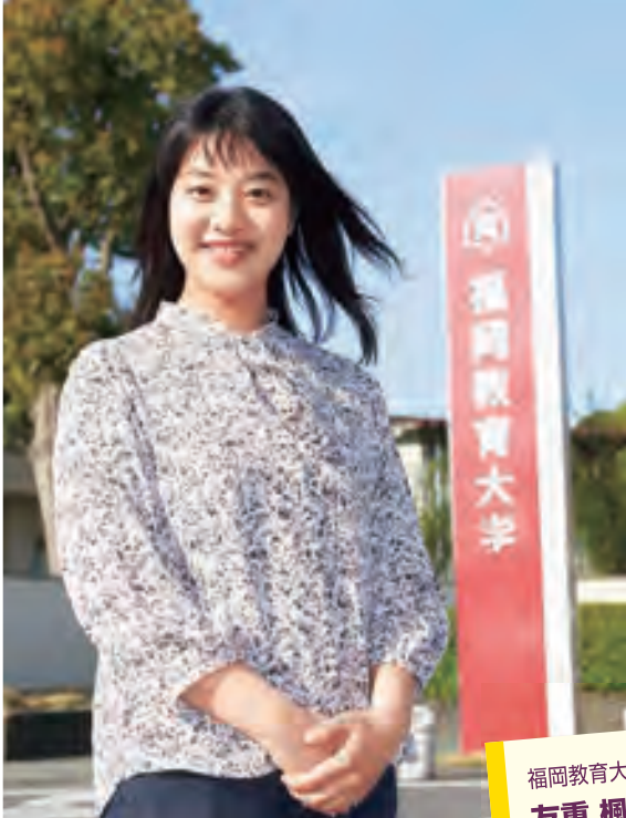
ともしげかえて●教職にある両親の勤めて姉と同じ筑女に違い、昨年春福岡教育大学教育学部初等教育教員養成課程に現役で合格。「日頃は厳しい先生が、体育祭では一緒に盛り上げてくださるなどメリハリがあり楽しむ時は思いっきり楽しむという筑女が大好きでした」と語る。