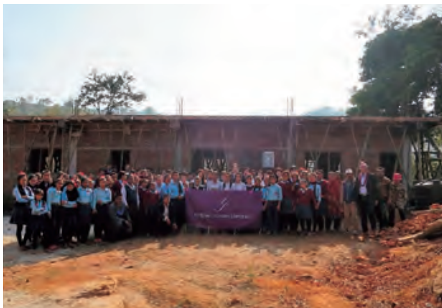
▲完成したラムサハ高校の新校舎(2017年2月)。

建設)を出しました。しか し、ネパールにはいまだ仮設 校舎で勉強している子ども 達がたくさんいます。私たち のプロジェクトでは引き続 き、ネパールの子ども達への 教育支援活動を続けていき