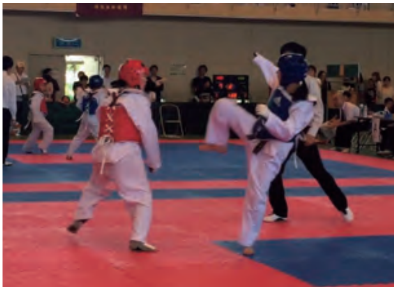
▲平成28年度福岡県大会にて。

今回の滞在中、シエアハウスを体験したり、観光に出かけた場所でご当地名物をいただいたり、何よりも、福岡を出なければ関わる事ができなかった人と出逢い、またその方たちから様々なお話を伺えたことが、私にとって本当に貴重な財産となりました。勇気を出して「復興・創生インターン」に参加して良かったと思いますし、感謝の気持ちでいっぱいです。そして今年の夏、お世話になった方々に逢いに行くために、女川町に行こうと計画中です！