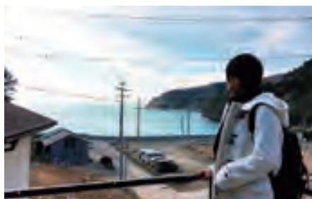
▲まだまだ復興半ばの海岸線を眺めながら。

ではなく『お家の人』と言うよう気をつけてください』との注意をいただきました。その時、私は震災から6年の月日が経ったけれど、たった6年しか経っていないのだと改めて感じました。最後に校長先生が、私たちに頭を深く下げて感謝の言葉を述べていらした姿を忘れられません。