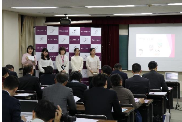
※昨年の発表シーン

筑紫女学園大学では実社会の課題解決に取り組む経験を通し、「社会人基礎力」に代表される社会に必要な資質・能力を認識し、自身の不足に気づくことで、今後何をすべきかに【めざめる】機会を提供する正課外キャリア教育<筑女「めざめ」プロジェクト>を実施しています。