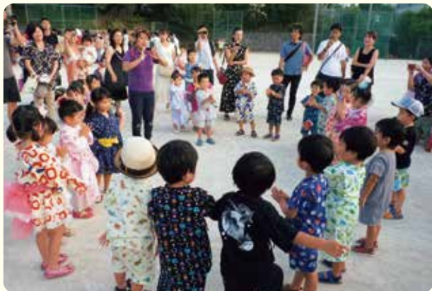
夏まつり 8月24日、子ども達が楽しみにしていた夏まつりを行いました。ゲームコーナーや軽食を楽しみ、最後はみんなで盆踊りを踊りました。