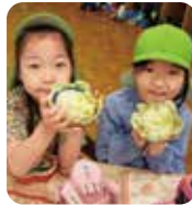
▶自分たちで掘ったたけのこで作ったたけのこごはんは最高!