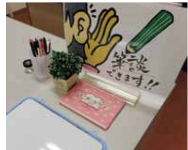
◀相談窓口では、一人ひとりと対話を大切に、解決・支援方法を一緒に考えます。

になりました。休憩スペースもあるため、授業の合間に「ラトナ」に立ち寄り、元気を回復して次の教室に向かう学生もいます。そして、何より支援に関わる学生や教職員が交流する場ができました。支援の目標は、教育の機会の平等を実現することですが、支援に関わるすべての人が互いに学び合い、成長