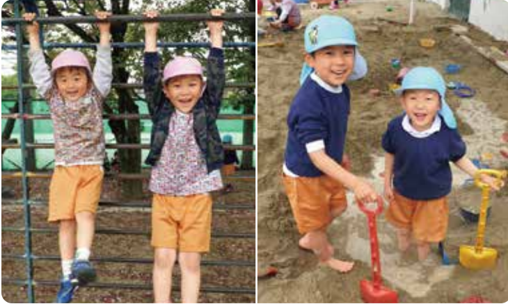
▲一人ひとりの発達段階を踏まえ、興味・関心を大切にしながら、子どもたちの「遊びを中心とした保育」に取り組んでいます。

園周辺の恵まれた自然環境の中で、子どもたちは元気に身体を動かし、草花や生き物にたくさん触れ、いろいろなことに興味・関心を持ち、五感を働かせながらイキイキと遊んでいます。自分で好きな遊びを見つけ、