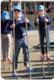
▶これだけ乗れたよ! 「竹馬披露会」。