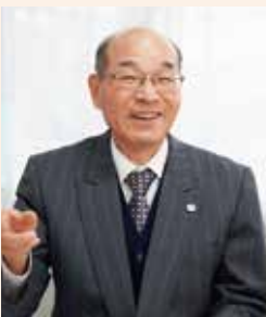
▶お父さんが来てくれた時の子どもたちの笑顔が素敵と八谷園長。

育つてほしい具体的な姿として「健康な心と体」「自立心」「協同性」「自然との関わり・生命尊重」など10項目が示されました。これらを本園に照らしみると、竹馬や稲作などいずれも私たちが地道に続けてきたことと合致します。これから本園の教育について、自信を持って進めていけばよいと確信しました。子どもたちのより良い教育を目指すには、教員の資質向上が一番ですが、保護者の方との連携も必要です。お父様方の活動「親父の会」(通称「らいおん組」)やお母様方の活動「絵本貸出ボランティア」「坂道ピカピカ大作戦」などを定着させ、一層の連携・強化を図っているところです。これは、幼稚園での子どもたちの活動を見ていただくとともに、園の運営に対するご意見を伺うことが大切であると考えます。本園は、こうした実践を積み上げ、教育課程も開かれた幼稚園として保護者の方々と一緒に、心身ともに健やかな子どもたちを育てて参ります。