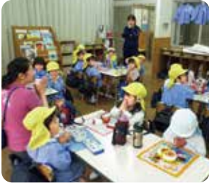
▲年少組「初めてお弁当」の様子。

週に3回の給食、残りの2日はお弁当の持参をお願いします。ご家庭では、どうしても子どもの好きな物が多くなりがちで、苦手な物にはなかなか口をつけない...といった話も聞きますが、給食では、みんなで同じものを味わうという経験が苦手な食べ物(例えば野菜など)も食べる事ができるキッカケとなったり、さまざまな旬の食べ物にも出合うことができます。また、お弁当を持参していただくことは、子どもたちがいつも食べ慣れている大好きなご家庭の味を、友だちと一緒に食べることで、より安心して楽しい食事の時