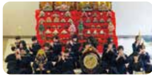
▲宗教部の生徒たちによる雅楽演奏。