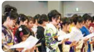
▲最後の短期大学部卒業生を送り出しました。