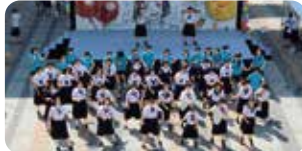
▲「CJカ～みんながヒロイン 未来は広いん?」をテーマに開催した紫苑祭。