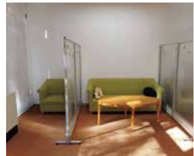
◀身体を休めたり、ひとりになって落ち着きたい時に利用できる休憩スペース。