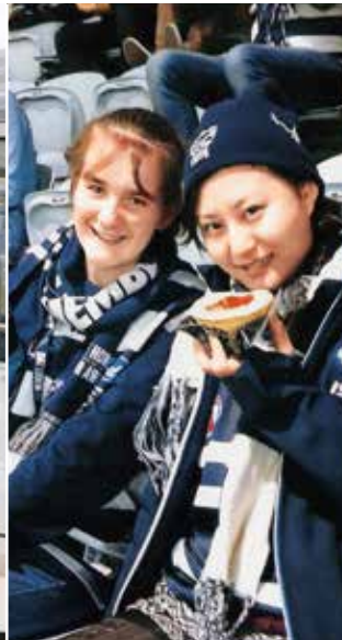
▲ホストファミリーが大ファンのオーストラリアン・フットボールチームの観戦。