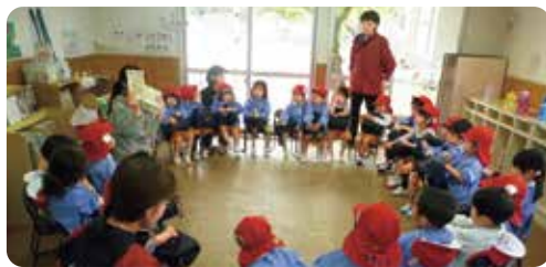
◀「自由保育」を保障するだけでなく、生活習慣などを身につけるための指導は丁寧にしています。

人ひとりのやりたいたいと思う気持ちとタイミングを大切に、子ども自身が意欲を持った時こそ、学びのチャンスにしたいと考えています。そのため、クラス毎に活動を始める時間を設定することができるよう時間割のない一日を過ごしています。