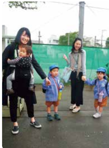
▲子どもの様子を保護者の方々と教職員が直接伝え合うことで、一人ひとりへのケアが充分に行き届くよう、年少の一学期のみ同伴登園・降園をお願いしています。