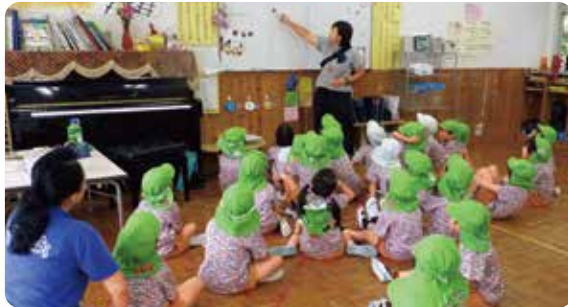
▶クラスの状況によって一日の活動内容を変えるなど、子どもの意欲を大切に保育を心がけています。