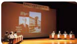
▲多くの卒業生が参加し、当時は懐かしく振り返った一日。