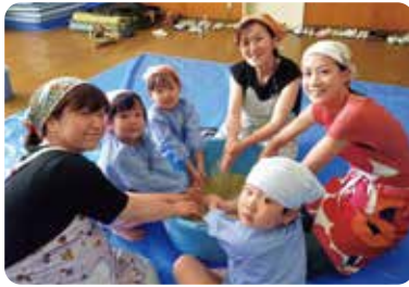
▲親子で参加する「みそ作り」(年長)のひとコマ。