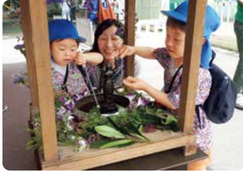
▲「花まつり」(写真)や「報恩講」をはじめ、さまざまな場面で「手を合わせることの大切さ」を身近に感じてくれるような取り組みを行っています。