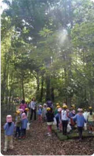
▲響流(こーる)の森では、本園年長組園児と響園小学校の1年生が合同で楽しむ行事も行っています。

どちらの森も、主に散歩に出かける際に利用しています。森は、時期によって様々な姿を見せてくれます。四季折々の虫や植物に触れながら季節を感じ、自然に触れる喜びや楽しさを知り、自然への興味関心を持つことができますようにしています。また、自然に触れるだけでなく、遊具