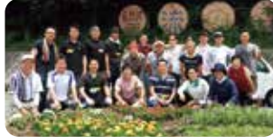
▲プール出しや花壇の整備などで協力いただきました。