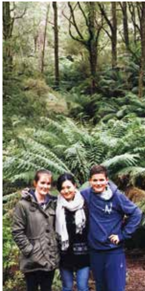
▲ホストファミリーと。家の近くには自然がたくさん!