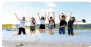
▲石垣島で実施。サンゴ礁文化などへの学びを深めました。