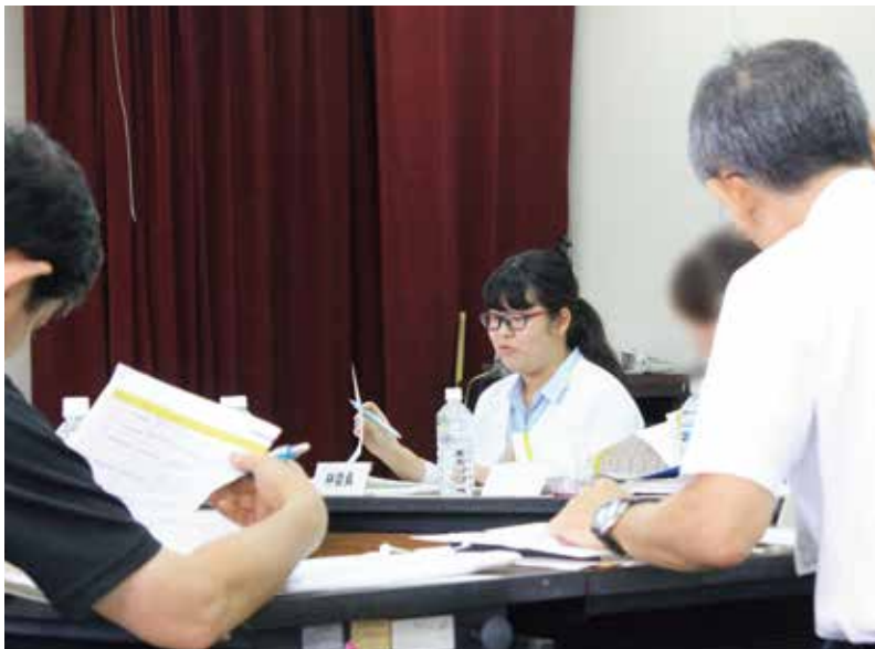
▲市役所職員の方々の説明と他の委員の意見を聞いて、評価を行っています。

勉強をはじめ、さまざまなことに積極的に取り組む筑女生の活躍ぶりを紹介するこのコーナー。今回は、太宰府市の事務事業外部評価委員を務めている大学生と、昨年夏、オーストラリアのセントポール・スクール(高校)に短期留学してきた高校生からのレポートをお送りいたします。