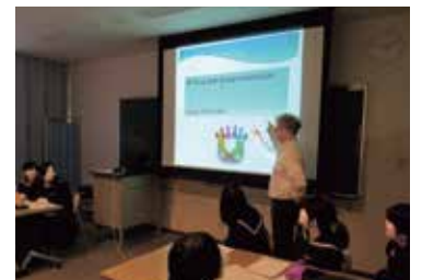
▲授業ではPCを使い、情報を視覚的に捉え、スムーズにディスカッションできるように工夫されています。

「ディスカッションやプレゼンテーションが中心のこの Sustainable Business and the Environmentプログラムは、まさに、「思考力」を伸ばし、チームで「協働し」、答えない問題に対して自分で考えて答えを見つけ出す「問題解決能力」を鍛えるプログラムとなっています。