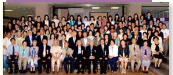
昨年6月11日に挙行了した「第49回」紫友会総会にて。