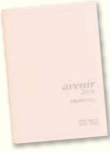
▲在学生の就職活動をサポートしている「avenir」。

主な活動として、年に一度の総会の開催、同窓会誌「紫友」の発行と発送を行い、代表は学園諸行事に参加しています。また、母校在学生支援として、「紫友会奨学金及び奨励金」の給付、新入生へ入学記念の校章を贈呈し、就職を控えた3年生全員には就職活動支援冊子「avenir(アヴニール)」を贈呈しています。同誌は、先輩学生による就職活動