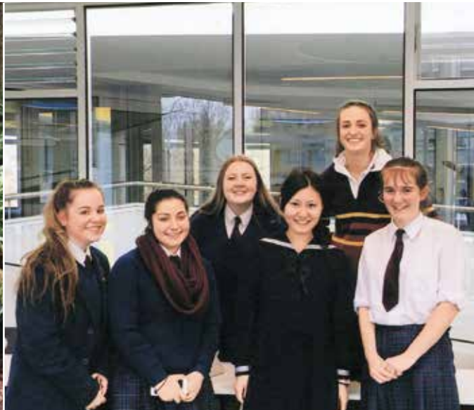
▲クラスメイトたちと。