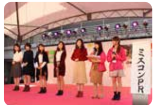
▲吉沢亮さんのトークショーも盛り上がった筑紫祭。