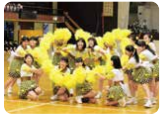
▲今年度の中学体育祭は黄ブロックが総合優勝を果たしました。