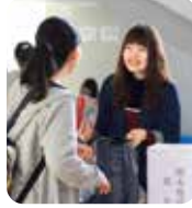
▶本学でも多くの募金活動やボランティアに携わりました。