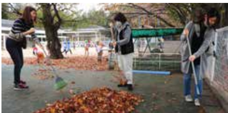
▲1回目の「ピカピカ大作戦」の後、「坂道が落ち葉だらけになっていたら気になってしょうがありません！」という保護者の声も聞かれるようになりました。

てくれていた園長先生の姿を見た保護者の方からの声があきつかけで、11月から毎週月曜日の朝1時間、有志のお母さんたちの力を借りて、「ピカピカ大作戦」という名の清掃活動がスタートしました。第1回目は30人ほどのお母さんたちが参加してくださいました。園長先生が一人ですると2時間、3時間とかかっていた坂道や園庭の清掃が、一緒にしてく