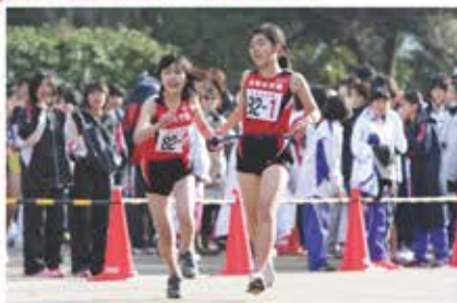
第1走者から第2走者への襷渡し。

夏の中体連、冬の駅伝に向けて、日々練習に励んでいます。今は7月の中体連まで残りわずかとなり最後の追い込み中です。みんな目の色を変えて頑張っています!